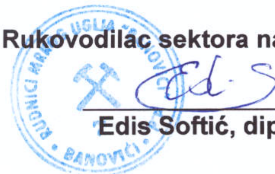
Edis Softić, dipl.ecc.